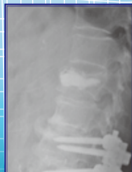
球囊擴張椎體成形術後