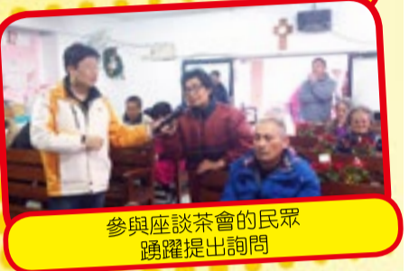
參與座談茶會的民眾踴躍提出詢問