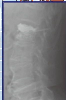
球囊擴張椎體成形術後