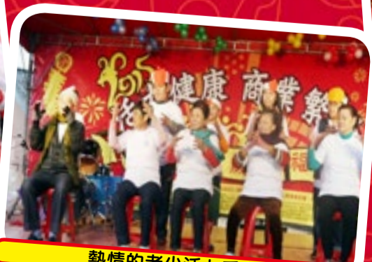
熱情的老少活力秀表演