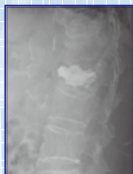
球囊擴張椎體成形術後