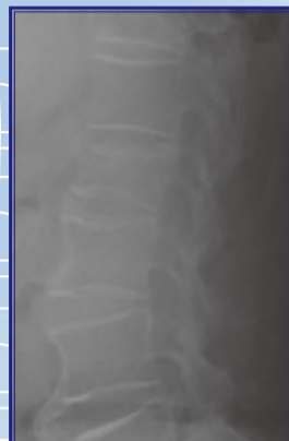
85歲女性 第二腰椎壓迫性骨折

任何醫療處置都有風險，儘管球囊擴張椎體成形術併發症較傳統手術為低，仍可能有心律不整停止，心肌梗塞或中風等狀況發生，血塊脂肪或骨水泥可能遊走造成血管或肺部栓塞，或是骨水泥滲漏造成神經血管損傷，這些雖因使用球囊擴張和低溫骨水泥降到極少，病患及家屬不可不知。