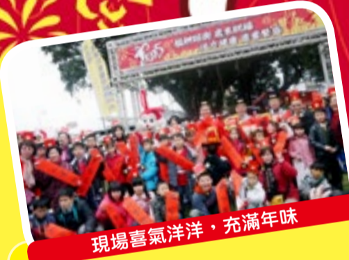
現場喜氣洋洋，充滿年味

一年一度的艋舺歲末踩街在1月31日舉行。今年繼續以「活力健康、商業繁盛」做為主題。本年度的參加人數再次的突破新高，從台北仁濟院、龍山老人服務中心及萬華兒童服務中心三個集合點出發、再分為七條路線，由萬華各社福團體、鄰里組織、社區民眾1500多人一起走入巷弄，拜訪了230多個友善店家，最後集結在和平青草園(仁濟療養院舊址)，展現萬華深厚的社區互助意識。