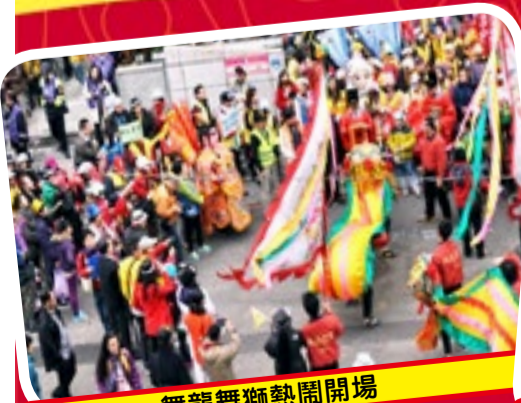
舞龍舞獅熱鬧開場

「艋舺踩街、歲末祝福」活動至今已經有八年的歷史，透過踩街的動員，讓社區的社福團體、組織、商家攜手協力，凝聚在地力量與資源，社政單位、民間社福團體、衛生部門、教育、警政體系的總動員，透過這樣的合作與彼此了解，讓各團體間的橫向連結與支援更好。今年活動有超過3500以上的人來參與，還在活動前發行了踩街報，整理了這八年來社區合作的成果希望，讓更多人可以看見萬華的生命力。期待未來繼續透過踩街活動的舉辦與各個單位的合作，讓彼此聯繫沒有距離，可以互相支援，共同解決問題，使萬華變成活力閃耀，多元特色的所在。