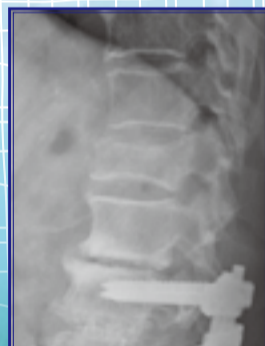
91歲男性 第一腰椎壓迫性骨折